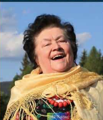
Nic nie robię i to lubię str. 19