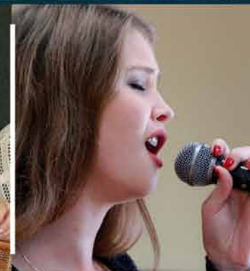
Prace wre, a koncert już 29.10! str. 17