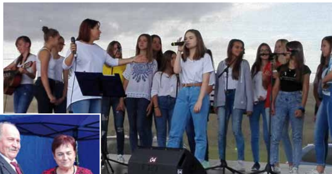
phot. arch. GOK w Rabe Wyżnej