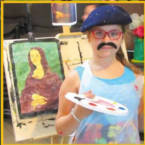
Letnie spotkania z kulturą i nauką str. 12