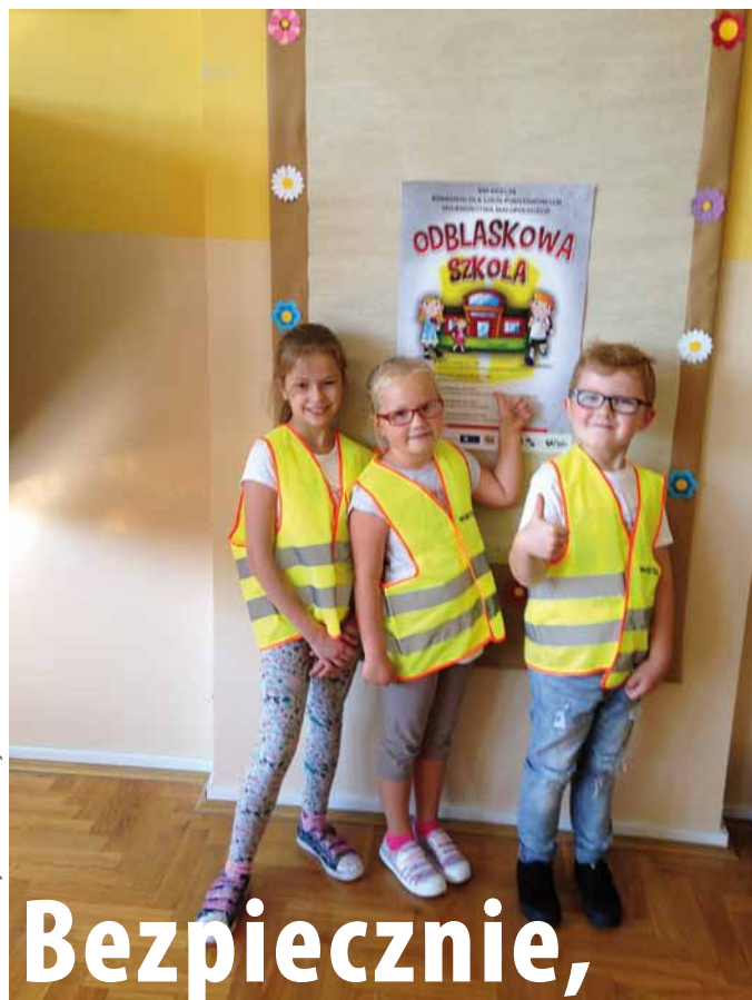
fot. arch. Szkoły Podstawowej nr 1 w Skawie