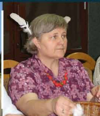
Rozkręcają Rabę Wyżną str. 20