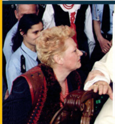
Kontynuowałam to, co inni zaczęli str. 20