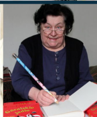
Felieton, czyli kilka refleksji nad... str. 19