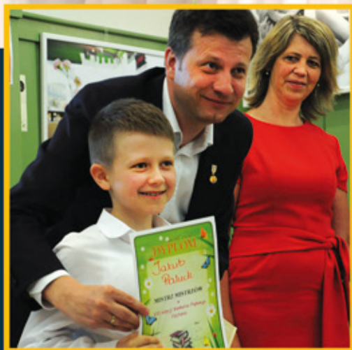
Mistrz Mistrzów z Harkabuza str. 9