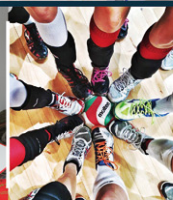
Mały - wielki klub str. 24