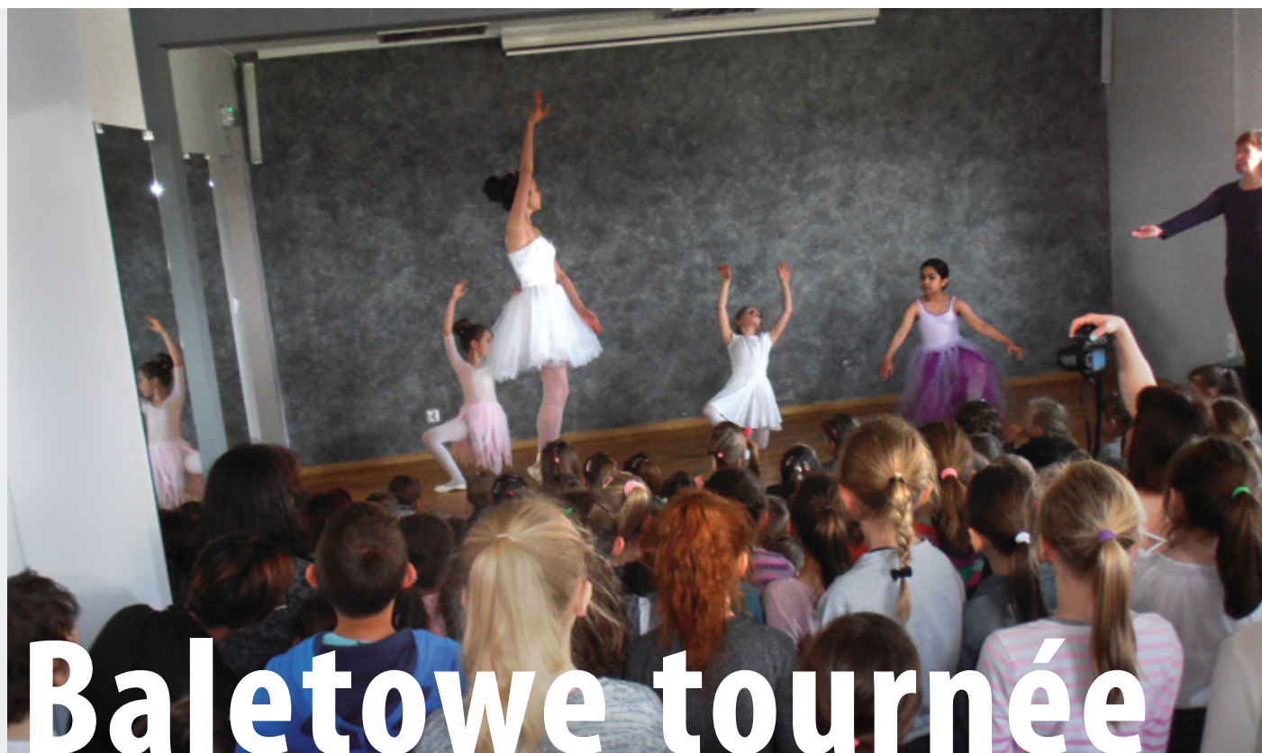
Na zdjęciu: występ w Gminnym Centrum Kultury w Spytkowicach