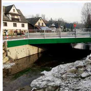
Mieszkańcy cieszą się z nowego mostu