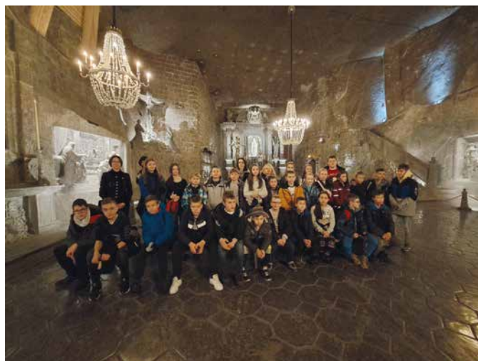
SP Bielanka, Kaplica Św. Kingi w Kopalni Soli w Wieliczce

Oprac. Zespół Ekonomiczno-Administracyjny Szkół Gminy Raba Wyżna