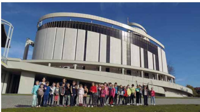
SP Skawa nr 3, Sanktuarium Bożego Miłosierdzia Kraków-Łagiewniki

Łączna wartość dofinansowania zadania wyniosła 182 904,00 zł, a wartość całkowita 347 054,00 zł.