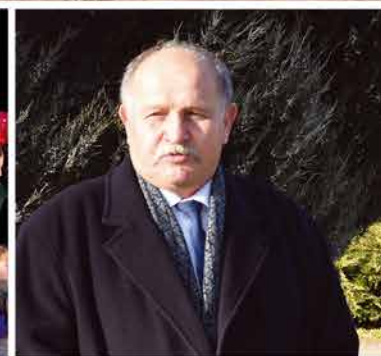
Dobra współpraca prowadzi do rozwoju