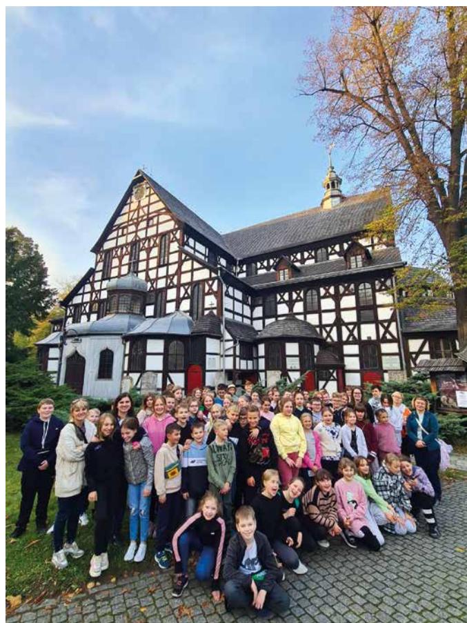
ZSP w Sieniawie, Kościół Pokoju w Świdnicy

Oprac. Zespół Ekonomiczno-Administracyjny Szkół Gminy Raba Wyżna