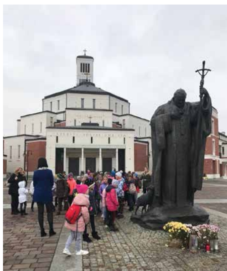
SP nr 1 w Skawie, klasa I-III, Centrum Jana Pawła II