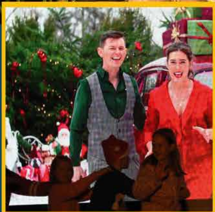
Mikołajki w GOK-u