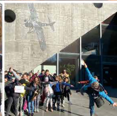
„Poznaj Polskę” w gminie Raba Wyżna