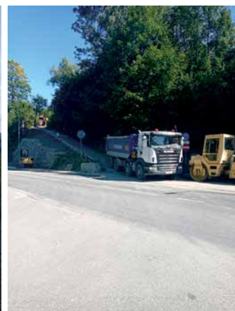
Domalówka Raba Wyżna

ich mieszkańców. Na bieżąco analizujemy wnioski składane przez radnych na sesjach Rady Gminy, wnioski składane przez mieszkańców na zebraniach wiejskich oraz napływającą do Urzędu Gminy korespondencję. W oparciu o zidentyfikowane w ten sposób potrzeby mieszkańców przygotowujemy projekt budżetu na kolejny rok i przedstawiamy Radzie Gminy do zatwierdzenia. Niektóre inwestycje wymagają opracowania dokumentacji technicznej, uzyskania wymaganych prawem pozwoleń, jak również regulacji stanu prawnego nieruchomości bądź pozyskania na ten cel nowych terenów. Realizacja inwestycji, ze względu na wysokie koszty przekraczające możliwości budżetu gminy, bardzo często wymaga również pozyskania środków finansowych z zewnętrznych źródeł. Te wszystkie czynniki powodują, że niejednokrotnie potrzeba kilku lat albo nawet kilku kadencji samorządu, żeby zrealizować duże zadania inwestycyjne związane np. z budową wodociągów czy kanalizacji sanitarnej. Nie zawsze są możliwości na to, by realizować w każdym roku budżetowym inwestycje jednocześnie w każdym z sołectw na terenie naszej gminy. W skali kilku lat środki finansowe przeznaczane na inwestycje realizowane w poszczególnych sołectwach są jednak zawsze dzielone sprawiedliwie.