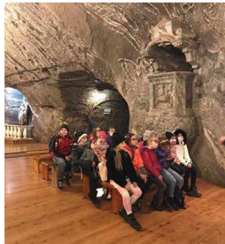
SP nr 1 w Skawie, klasa I-III, Kopalnia soli w Bochni