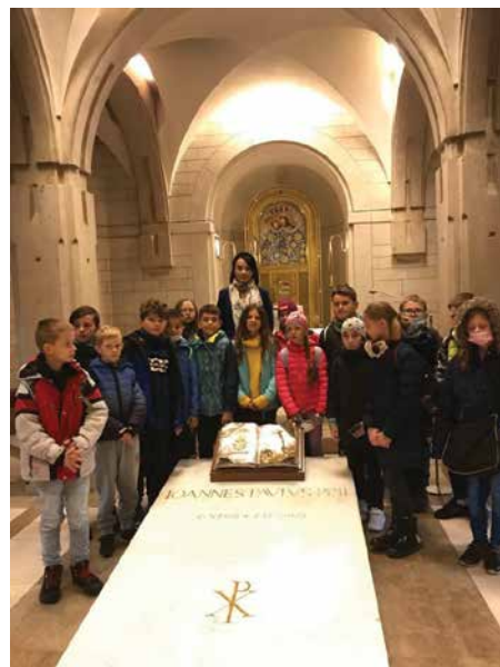
SP nr 1 w Skawie, klasa I-III, Sanktuarium Łagiewniki