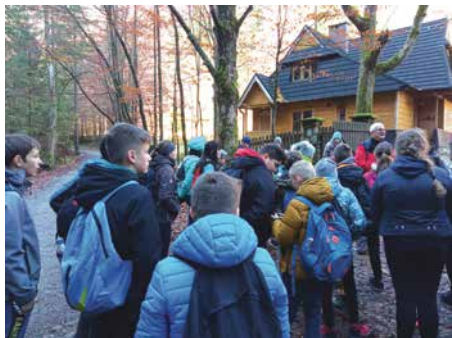
SP Harkabuz, kl. IV-VIII, Willa Atma w Zakopanem

W ramach zadania uczniowie szkół mogli uczestniczyć w jedno bądź trzydniowych wycieczkach. Każda szkoła miała możliwość wyboru punktów wycieczki z umieszczonego na stronie ministerstwa „Wykazu Punktów Edukacyjnych”.