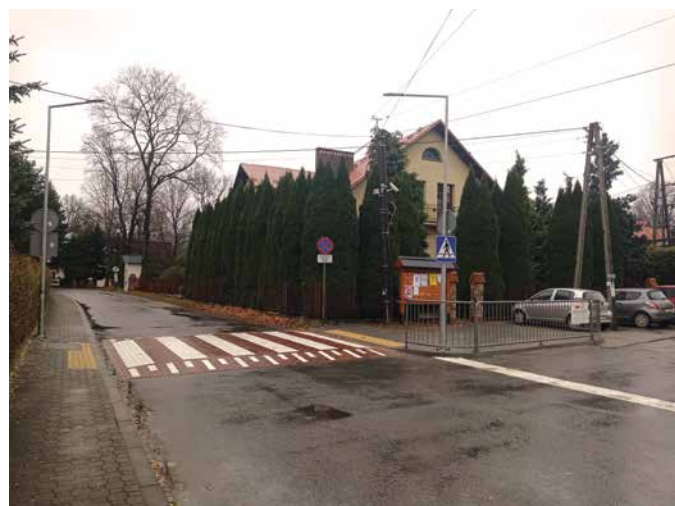
Przejście dla pieszych w Rabie Wyżnej

Pomimo trudnego okresu pandemii, w jakim przyszło nam funkcjonować, należy zaliczyć rok 2021 do udanych pod względem realizowanych inwestycji. Modernizowane były drogi gminne, powstały nowe odcinki kanalizacji sanitarnej, nowe chodniki