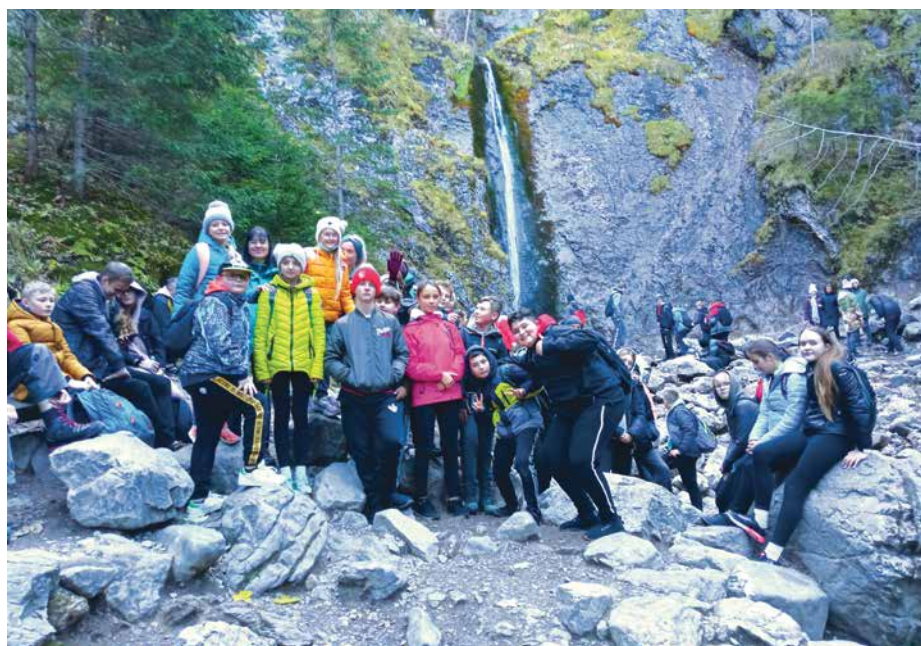
SP Harkabuz, kl. IV-VIII, Zakopane

Oprac. Zespół Ekonomiczno-Administracyjny Szkół Gminy Raba Wyżna