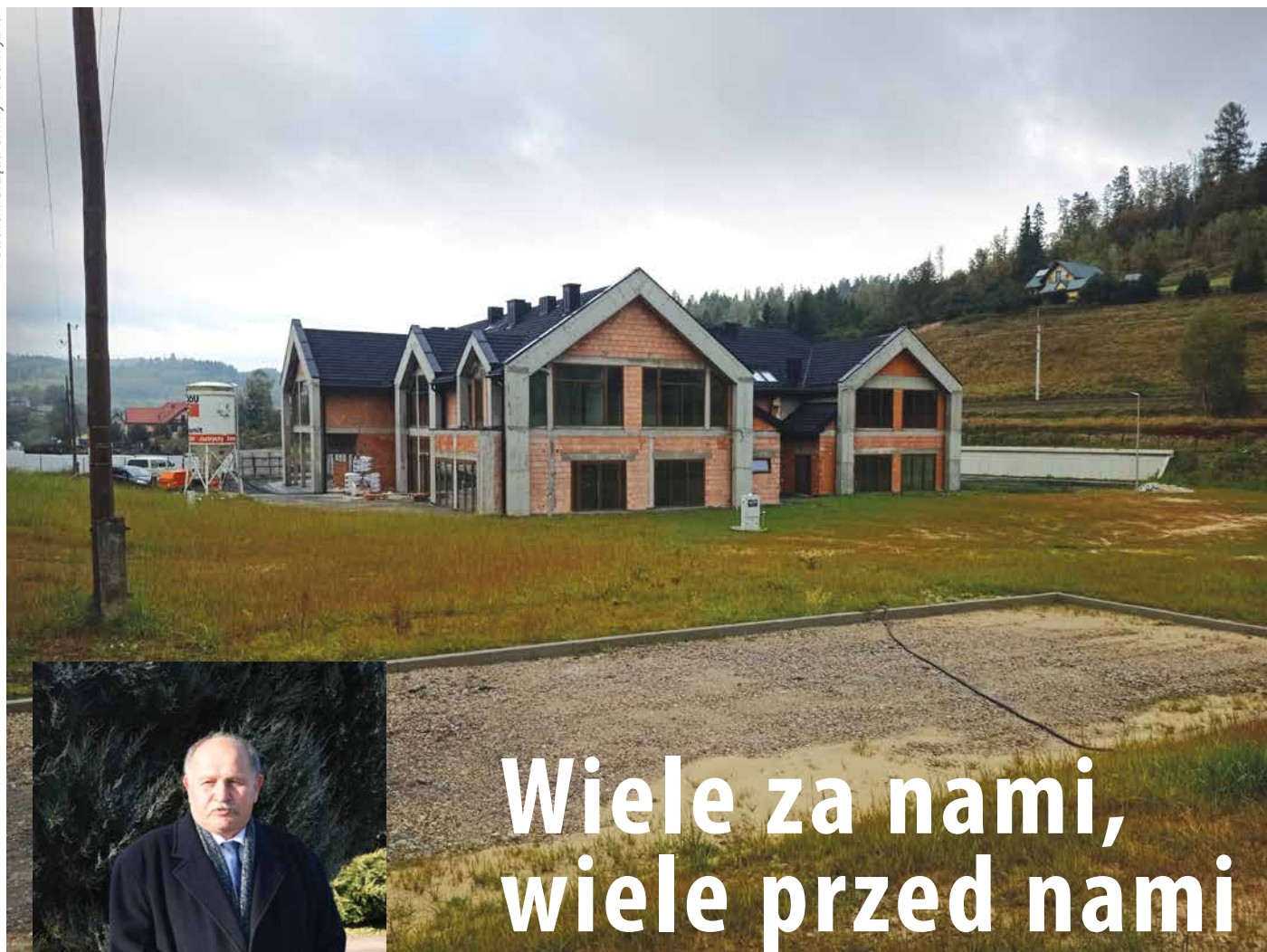
Budynek wielofunkcyjny w Sieniawie