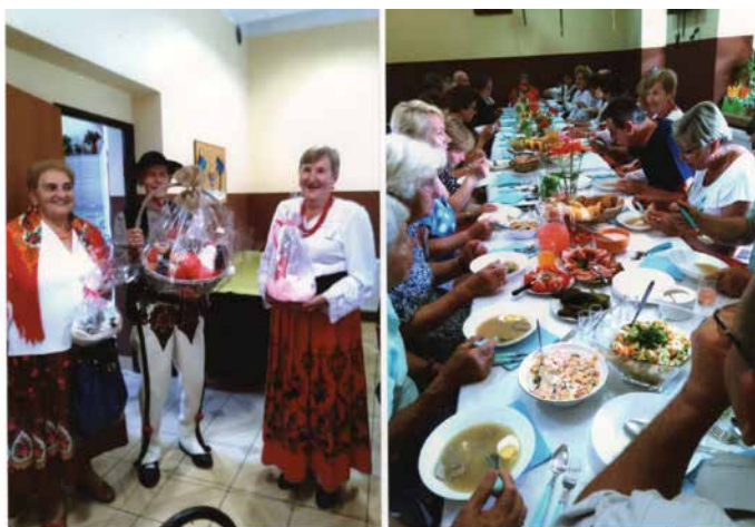
Wizyta w Czyżówce

w starej plebanii śpiewy i rozmowy o dalszej współpracy przy bogatym w przysmaki regionalne stole.