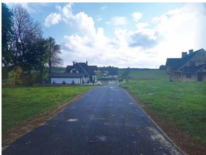
Ziobrówka w Skawie

O jakie inwestycje najczęściej wnioskowali w tym roku mieszkańcy i w jakim stopniu udało się wyjść naprzeciw ich oczekiwaniom?