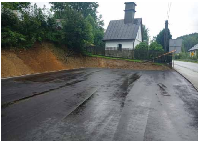
Plac postojowy w Bielance

- Od wielu już lat największa liczba składanych przez mieszkańców wniosków dotyczy remontów, modernizacji i budowy dróg gminnych oraz obiektów mostowych znajdujących się w ich ciągach. Na terenie całej gminy jest kilkaset kilometrów dróg gminnych oraz kilkadziesiąt obiektów mostowych. Przez ostatnie lata bardzo wiele odcinków dróg gminnych zostało wyremontowanych i zmodernizowanych. Potrzeby w tym zakresie są jednak nadal ogromne, patrząc na sytuację w terenie i wnioski składane przez mieszkańców. Dodatkowo sytuację w tej kwestii pogorszył fakt wystąpienia w miesiącu sierpniu br. bardzo intensywnych opadów atmosferycznych, które spowodowały wielomilionowe straty w infrastrukturze drogowej. Uszkodzone, podmyte zostały drogi gminne i inne obiekty infrastruktury publicznej. Obecnie na terenie naszej gminy prowadzone są prace budowlane związane z modernizacją linii kolejowej Sucha Beskidzka – Chabówka – Zakopane, z czym związane jest inten-