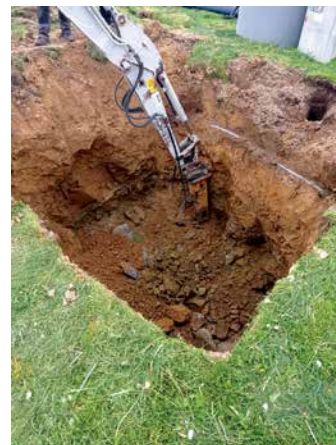
Budowa kanalizacji w Rabie Wyżnej

nym na roli Stachurówka. W Podsarniu planowana jest budowa nowego obiektu z przeznaczeniem na przedszkole i ośrodek zdrowia. W Rokicinach Podhalańskich, Rabie Wyżnej i Podsarniu chcielibyśmy rozpocząć inwestycje związane z budową nowych obiektów mostowych. W miejscowości Harkabuz planujemy rozpocząć budowę miejsc postojowych w sąsiedztwie szkoły podstawowej. W Bukowinie Osiedlu, Harkabuzie i Podsarniu realizowane będą prace projektowe dotyczące budowy chodników przy drogach powiatowych, w których gmina Raba Wyżna partycypuje finansowo. Chcielibyśmy w przyszłym roku zakończyć prace projektowe związane z kontynuacją budowy chodnika przy drodze wojewódzkiej. W Rokicinach Podhalańskich wykonywane będą nowe bezpieczne przejście dla pieszych w sąsiedztwie szkoły podstawowej.