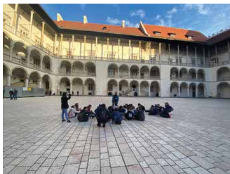
SP w Bielance, klasa IV-VII, Muzeum Archeologiczne w Krakowie

Uczniowie klasy IV-VIII Szkoły Podstawowej nr 3 im. Brata Alberta w Skawie i Szkoły Podstawowej im. Marii i Lecha Kaczyńskich w Podsarniu w ramach 3-dniowej wycieczki odwiedzili m.in. Zamek Królewski w Warszawie – Rezydencję Królów Rzeczypospolitej,