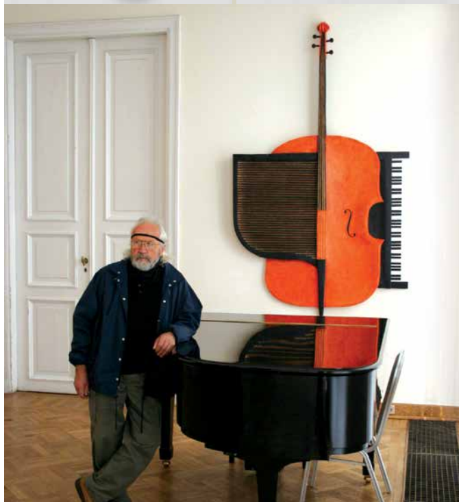
Wystawa indywidualna (2007) w Muzeum Narodowym w Warszawie