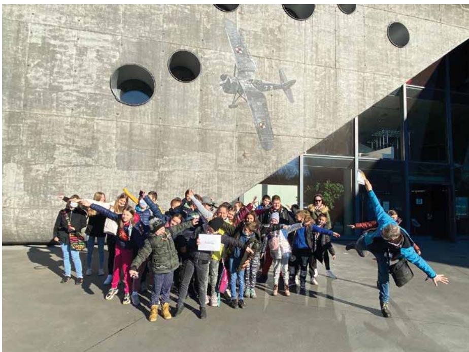
SP w Bielance, klasa IV-VII, Muzeum Lotnictwa Polskiego w Krakowie

Przedmiotem przedsięwzięcia była realizacja zadań mających na celu uatrakcyjnienie procesu edukacyjnego dzieci i młodzieży poprzez umożliwienie im poznawania Polski, jej środowiska przyrodniczego, tradycji, zabytków kultury