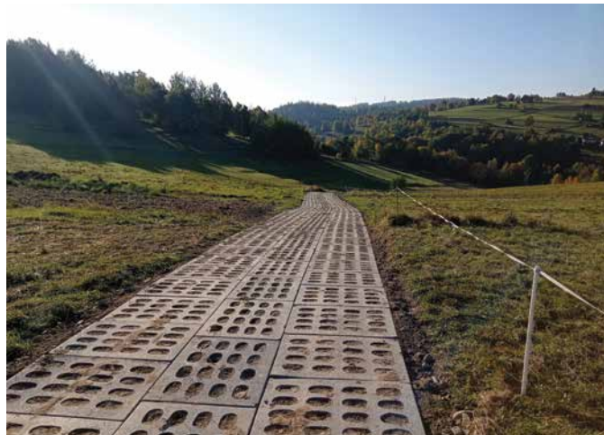
Olesiakowa, Żądłakowa w Harkabuzie

Planujemy w roku 2022 rozpocząć nowe inwestycje związane z budową kanalizacji sanitarnej w Rokicinach Podhalańskich oraz kolejnych jej etapów w Rabie Wyżnej. W miejscowości Skawa chcielibyśmy rozpocząć inwestycje związane z rozbudową sieci wodociągowych oraz budową zbiorników retencyj-