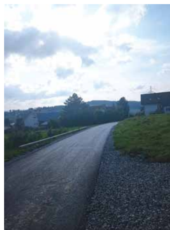
Jaroszówka w Skawie

- Każde z sołectw na terenie naszej gminy ma inne potrzeby wynikające z jego specyfiki, położenia, uwarunkowań komunikacyjnych, jak też różnych potrzeb zgłaszanych przez