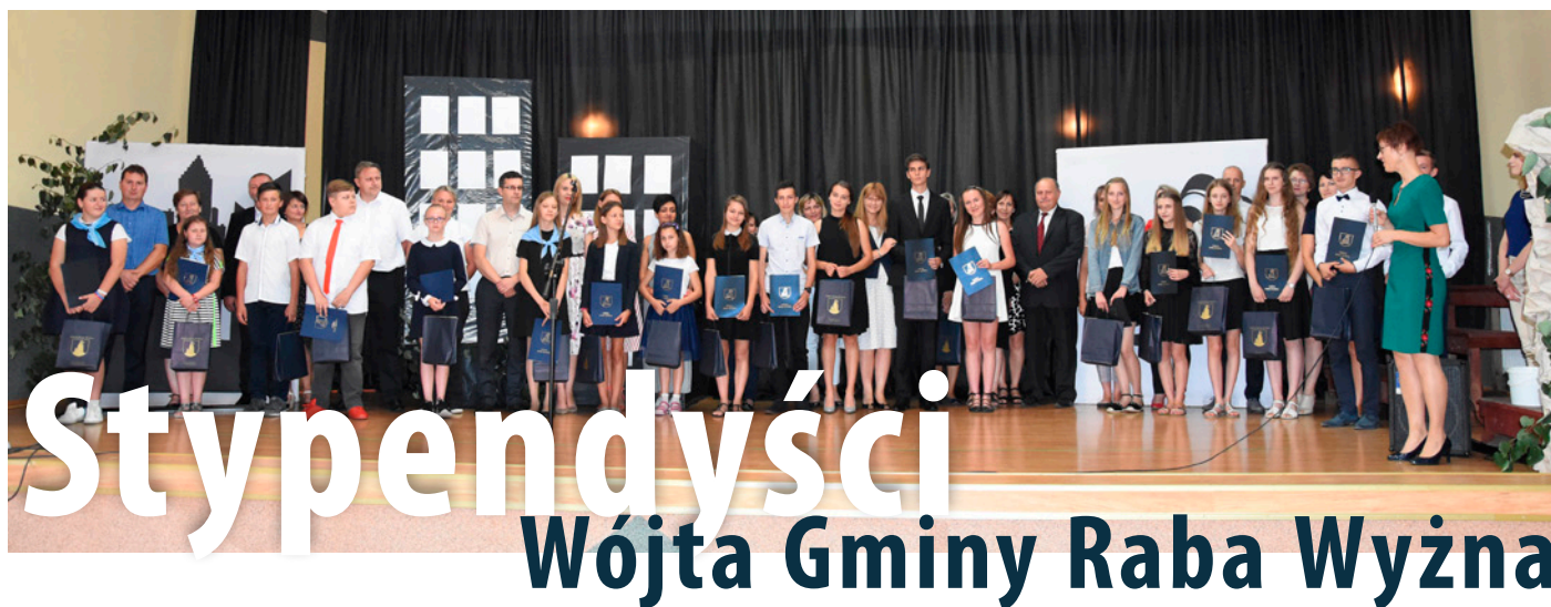
For. arch. GOK w Rabie Wyżnej

Kierownik Zespołu Ekonomiczno-Administracyjnego Szkół Gminy Raba Wyżna