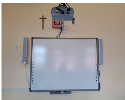
Tablica multimedialna z projektorem