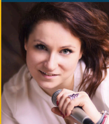
Muzyka sposobem na życie str. 27