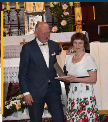
Wyróżniona za ocalenie dworu w Sieniawie str. 9