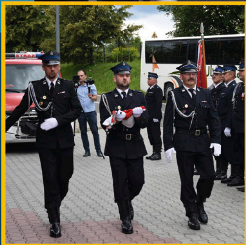
110 lat OSP w Rabie Wyżnej str. 13