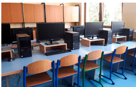
Pracownia komputerowa - komputery uczniowskie