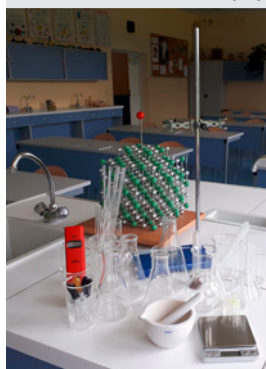
Wyposażenie pracowni przyrodniczej - zestaw szkła laboratoryjnego