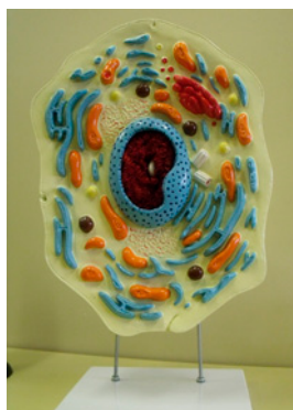
Pomoc dydaktyczna do pracowni biologicznej - model komórki zwierzęcej

W ramach projektu przeszkolono również kadrę pedagogiczną prowadzącą zajęcia dodatkowe z uczniami. Szkolenia z zakresu stosowania technologii informacyjno-komunikacyjnych oraz szkolenia dotyczące stosowania nowoczesnych metod dydaktycznych w nauczaniu były prowadzone przez trenerów Stowarzyszenia Miasta w Internecie z siedzibą w Tarnowie. Stowarzyszenie