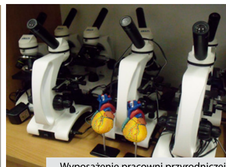
Wyposażenie pracowni przyrodniczej - mikroskop szkolny-terenowy

Gmina Raba Wyżna od 1 sierpnia 2017 r. realizuje dwa projekty dofinansowane ze środków Unii Europejskiej pn. „JA w świecie = przyroda + matematyka + informatyka” adresowany do uczniów oddziałów gimnazjalnych oraz VII i VIII klas szkół podstawowych oraz pn. „Matematyka, przyroda, informatyka - znam, umiem i rozumiem”, w którym biorą udział uczniowie klas od I do VI szkół podstawowych.