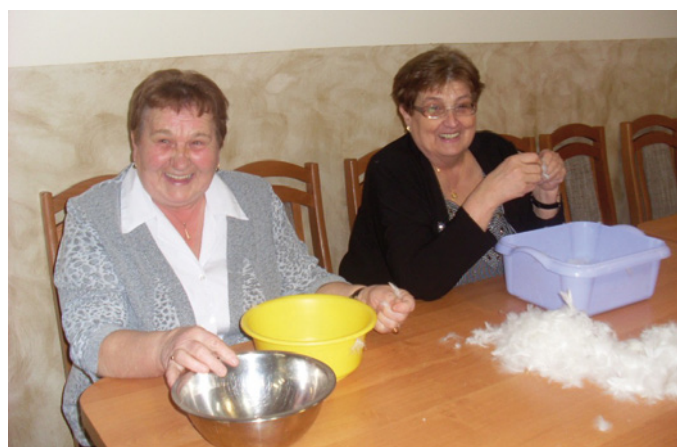
Skubanie pierza 2016

Koło prowadzi kronikę, która dokumentuje wszystkie wydarzenia z życia rabiąskich seniorów. Skrupulatność, z jaką jest prowadzona, jest godna podziwu. Swoje miejsce w kronice ma każde wydarzenie, które ilustrują liczne zdjęcia i szeroki opis. Kronika liczy już siedemnaście tomów i jest imponujących rozmiarów historią działalności Koła nr 1 Polskiego Związku Emerytów Rencistów i Inwalidów w Raby Wyżnej. Jej lektura to wciągająca podróż – historia ludzi tworzących koło i rozwijających je przez kolejne lata, ciekawych wydarzeń z udziałem seniorów oraz wycieczek, bliższych i dalszych, które stały się znakiem firmowym koła. Kronika to dowód i duma z 28-letniej historii. Podobną skrupulatność spotyka się tu we wszystkim – w prowadzeniu dokumentacji, w organizacji wycieczek i w sprawozdaniach z działalno-