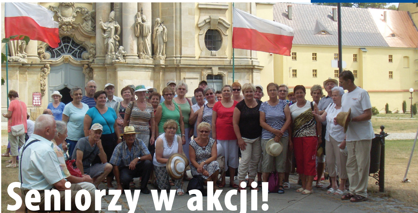
Przed Zamkiem Książ w Wolbrzysku