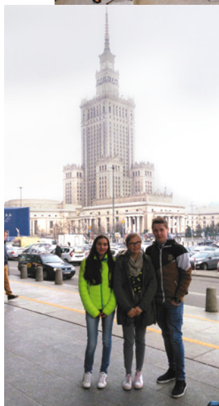
Laureaci przed Pałacem Kultury

W czasie naszego 3-dniowego pobytu w Warszawie, organizatorzy konkursu zapewnili nam super komfortowe warunki pobytu (**** hotel); warsztaty doszkalające z zakresu autoprezentacji i kreatywnego rozwiązywania problemów indywidualnie i w grupie; zwiedzanie Centrum Pieniądza NBP oraz Centrum Kopernika w Warszawie, a także cenne nagrody. Zwiedziliśmy też warszawskie Stare Miasto i podziwialiśmy ogrom Stadionu Narodowego.