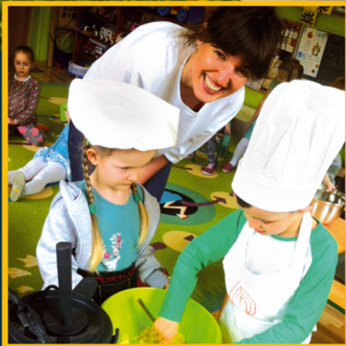
Gotowanie z finalistką „MasterChefa” str. 8