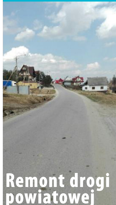
Droga przez Bukowinę Osiedle