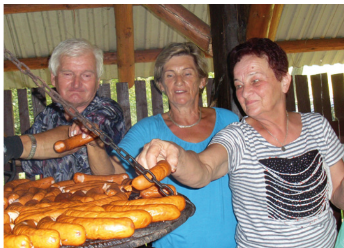
Ognisko 2016

Na każdym kroku seniorzy udowadniają, że są całkowicie samodzielni i samowystarczalni. Wszystkie imprezy, łącznie z częścią gastronomiczną, wycieczki czy spotkania organizują sami, delegując do konkretnych zadań wyznaczone osoby. Gdy nadchodzi wycieczka są bardzo dobrze przygotowani – ktoś wcześniej robi do termosów kawę, drugi kupuje drożdżówki, a w autobusie są dyżurni, którzy mają za zadanie szybko i sprawnie rozdać napoje i przeką-