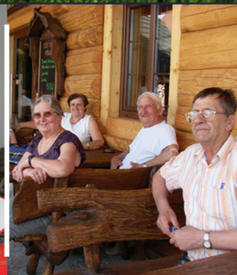
Seniorzy w akcji! str. 21