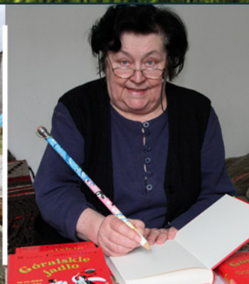
Felieton, czyli kilka refleksji nad... str. 17