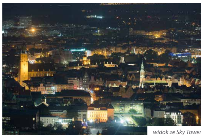
widok ze Sky Tower