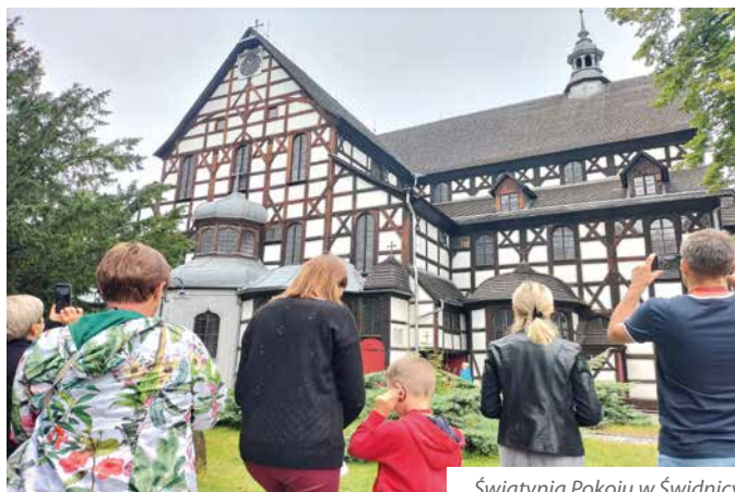
Świątynia Pokoju w Świdnicy