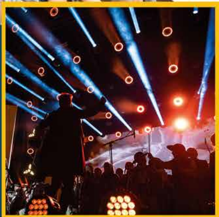
III Największa Górska Majówka w Polsce