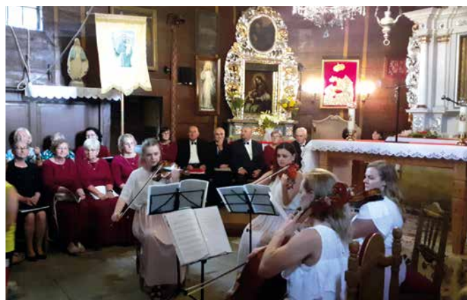
Materiały Stowarzyszenia Ochrony Dóbr Kultury i Dziedzictwa Narodowego w Sieniawie/Oprac. Anna Piaskowy

Kulinarną prezentację potraw regionalnych wraz z poczęstunkiem przygotowało gościnnie Koło Gospodyń Wiejskich z Bukowiny Osiedle.