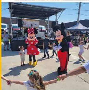
Pomoc za oceanu