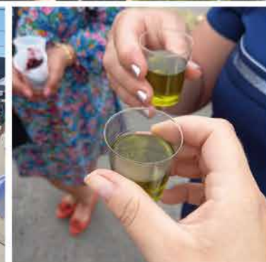
Smaki lata, czyli piknikowo w gminie Raba Wyżna