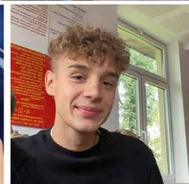
250 godzin na grę