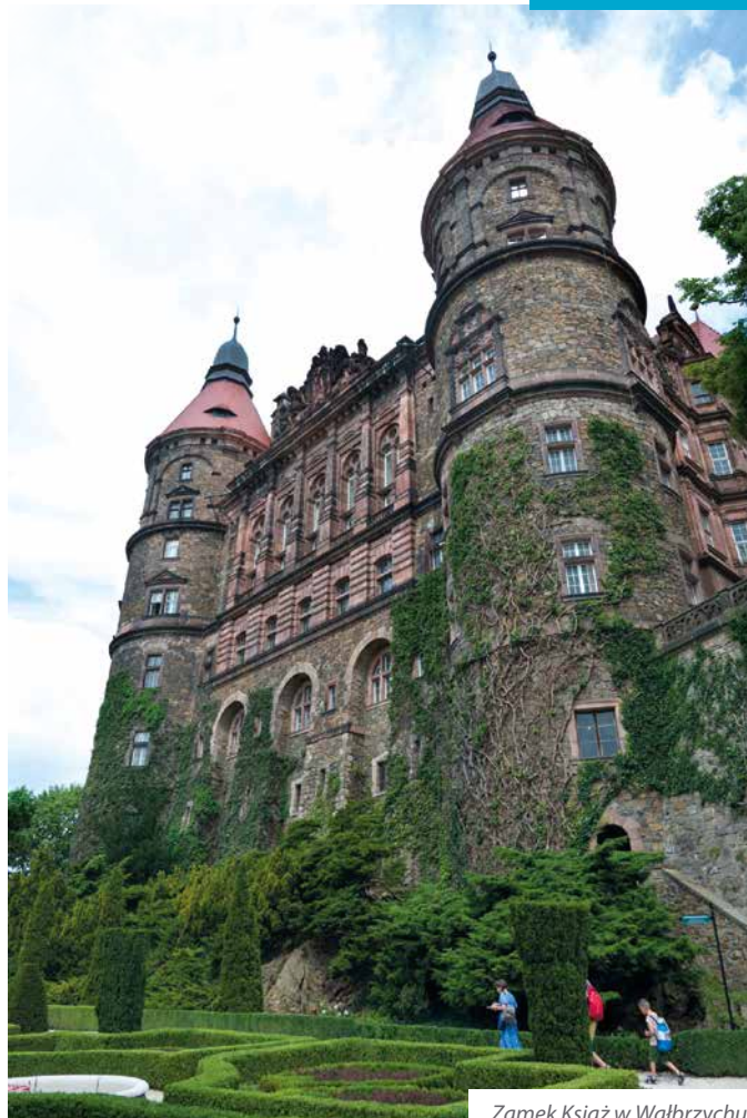
Zamek Książ w Wałbrzychu

Wyjazd miał charakter nie tylko edukacyjny i kulturalny, ale także integracyjny. Wśród uczestników były dzieci z rodzicami, młodzież, dorośli i seniorzy.