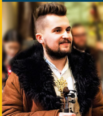
Dowódca małej armii str. 16