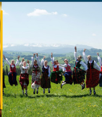
Gdy serce bije w rytmie folkloru str. 19